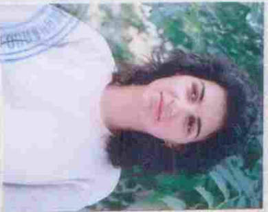
(Фигура на презентация)